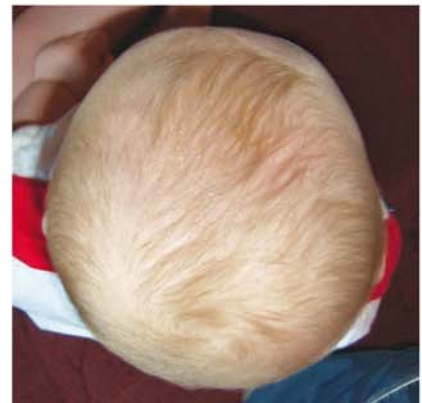
Después del Tratamiento